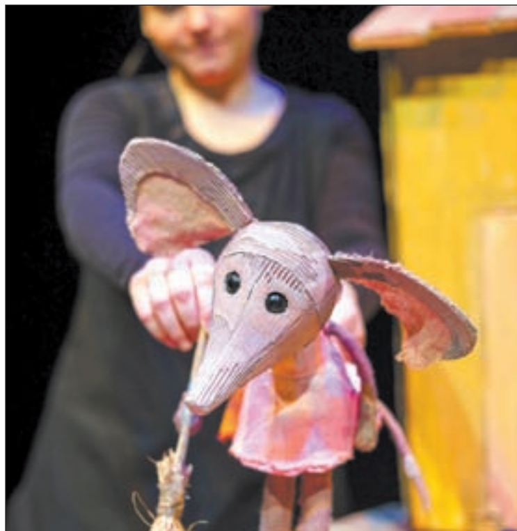
Imatge de l'espectacle 'La rateta que escombrava l'escaleta'

Així, DMA Producciones i la plataforma Igualtat Creativa van demanar a la companyia lleidatana la seva col·laboració en un experiment que es va realitzar amb els nens i nenes i adolescents del