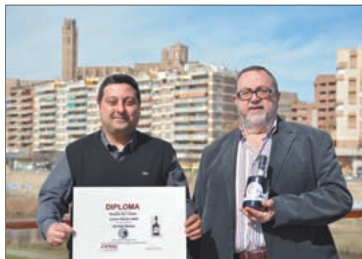
La Ratafia està feta amb nous verdes del Jussà

va la reacció del públic davant els comportaments intolerables i poc respectuosos del Llop envers la Caputxeta Vermella. Amb el resultat va produir-se un vídeo publicat el passat 8 de març que ja ha tingut més de 14.000 visualitzacions a Youtube i més de 40.000 a les xarxes socials.