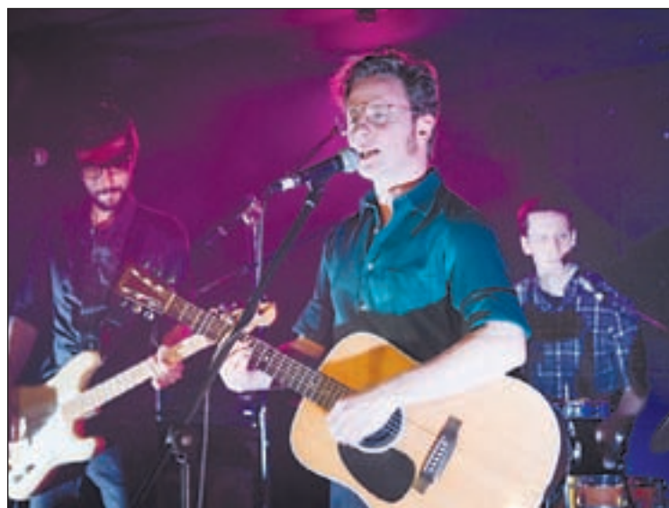
Mishima se encuentra promocionando su disco 'Ara i res'

La tercera entrega del festival de verano del Pallars se llevará a cabo del 27 al 29 de julio con las actuaciones estelares de Mishima, Gossos y Maria Arnal i Marcel Bagés, respectivamente. Después de cada concierto se contará con la participación de un conocido DJ, iniciando que se ha confiado a Miqui Puig, Luca Feller y Miguelito Superstar.