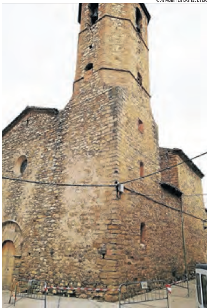
Les tanques al voltant del campanar de Guàrdia de Noguera.

Aquestes obres consistiran a renovar els bastidors, enganxaments i suports i la instal·lació d'un nou sistema de mecanització que permeti que les campanes puguin tornar a girar. D'aquesta manera, Guàrdia de Noguera podrà recuperar la tercera campana. El primer edil va apuntar que "les campanes són un element patrimonial important", que toquen els quarts, les hores, la celebració de les misses i la mort dels veïns.