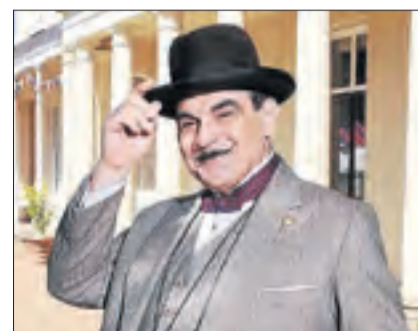
David Suchet com a 'Poirot'.

Si poden i tenen temps i ganes passin per Paramount Channel, que abandonant el cine, es passa ara a les sèries i de dilluns a divendres, durant de la tarda, emeten els 70 capítols de Poirot –sí, és veritat, en repeteixen força i abans ja s'havien pogut veure a 8TV–. Una producció britànica protagonitzada per David Suchet (Londres, 1946), un prestigiós actor teatral format a la Royal Shakespeare Company, la qual cosa és un immillorable aval i que, segons el nostre parer, és