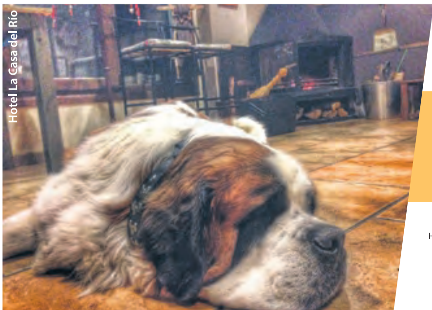
Hotel La Casa del Río