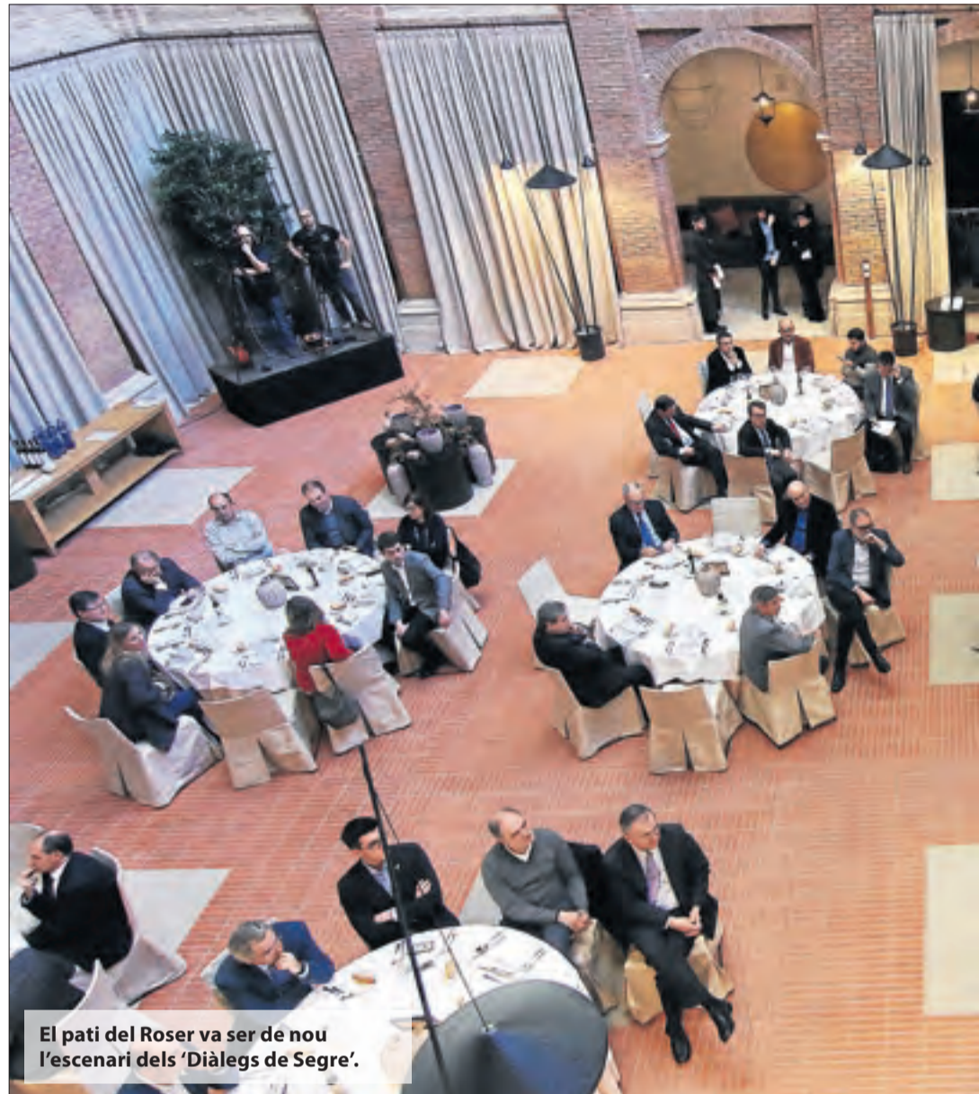
El pati del Roser va ser de nou l'escenari dels 'Diàlegs de Segre'.

És un concepte que pot aplicar-se a tot arreu. La mobilitat és un servei al ciutadà i el que és important és gestionar-la de manera eficaç.