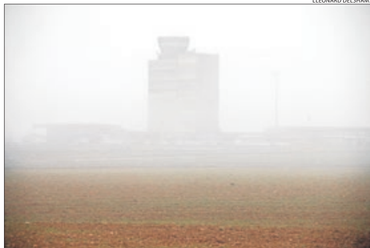
L'aeroport d'Alguaire, cobert per la boira diumenge passat.

comercial de l'aeroport lleidatà es va basar en els vols d'hivern del Regne Unit i els de l'aerolínia israeliana Arkia (que no repetirà aquest any, tal com va