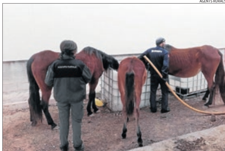
Rurals i Bombers van subministrar dissabte aigua als equins.