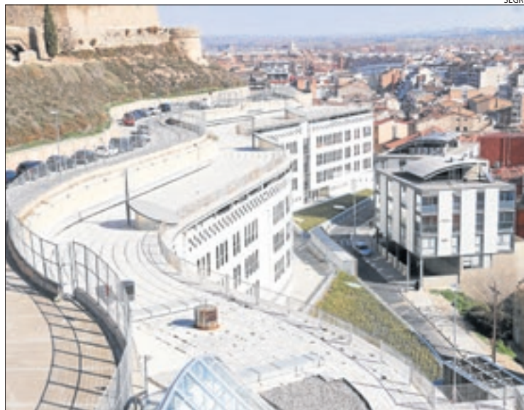
Imatge d'arxiu de l'edifici judicial del Canyeret.