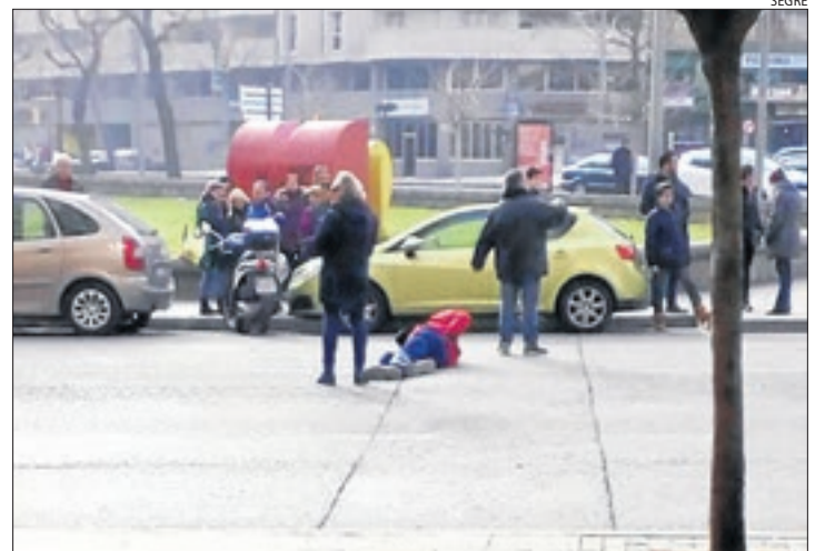
Un motorista va resultar ferit ahir en una col·lisió a Lleida.

Lleida es van registrar dos accidents més. El primer va ocórrer la nit de dilluns a la intersecció dels carrers Pere de Cava-sèquia i Jeroni Pujades però