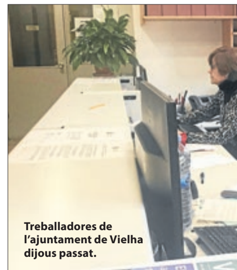
Treballadores de l'ajuntament de Vielha dijous passat.

■ L'empresa privada Wicat ha fet dels petits pobles del Pirineu el seu principal mercat, als quals ofereix fins a vint megues de velocitat de descàrrega a través d'enllaços a repetidors. Segons un dels operadors de la companyia, que treballa amb