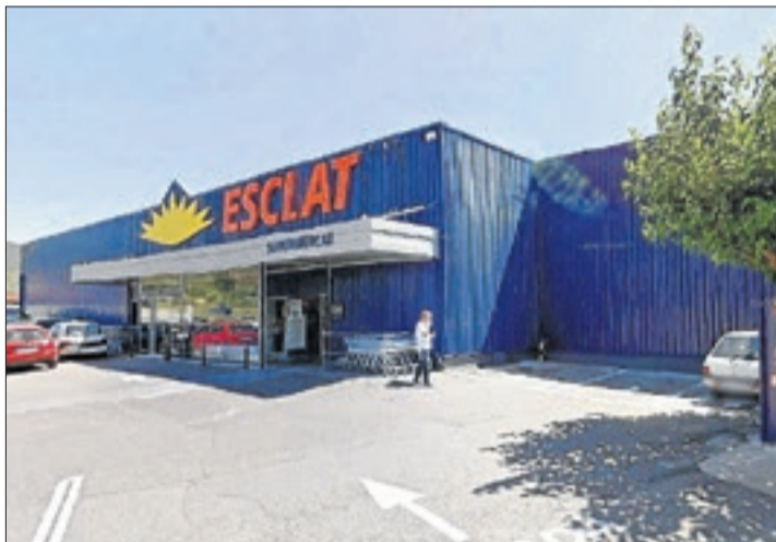
L'actual establiment d'Esclat Bonpreu a Tremp.

LEIDA | La cadena de supermercats Esclat Bonpreu ha posat en marxa un projecte per duplicar la superfície de l'actual establiment que té a Tremp, que passaria dels 900 metres quadrats a uns 1.800. Així ho van corroborar aquesta setmana fonts municipals, després que l'ajuntament hagi donat l'aprovació inicial a canvis en el pla d'ordenació urbanística (POUM) per fer possibles aquestes obres. Aquesta iniciativa arriba un any després que la cadena de supermercats Mercadona aparqués el seu projecte per obrir un nou