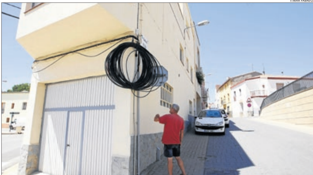
Imatge d'arxiu de fibra òptica a Vilanova de Segrià, on el consistori va parar les obres el 2016.