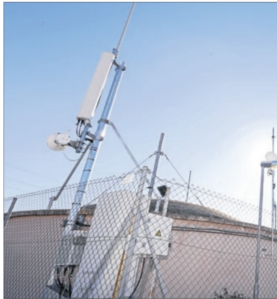
Antenes d'empreses operadores de WiMax instal·lades al dipòsit municipal d'aigua

■ Seròs, Maials i Alcarràs es van convertir l'any passat en els primers pobles del sud del Segrià en tenir fibra òptica, una cosa que semblava una possibilitat remota anys enrere al considerar que la planificació de les principals operadores donen prioritat a ciutats i als pobles amb més població. En el cas d'aquests tres municipis, la fibra ha arribat de la mà de l'empresa lleidatana Serosense Telecom, filial de la companyia Eléctrica Serosense. Altres noves firmes afavoreixen també l'expansió d'aquesta tecnologia a Lleida.