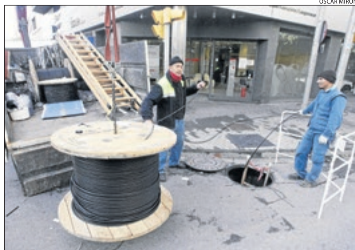
Imatge d'arxiu d'instal·lació de fibra òptica a Lleida.

■ Dos ajuntaments de Lleida, els de Rialp i Lles de Cerdanya, es van convertir l'any passat en els primers a patir el segrest de la informació dels ordinadors mitjançant l'encriptat dels arxius i exigències de rescat en bitcoins. Rialp va poder recórrer a còpies de seguretat i Lles va acabar pagant.