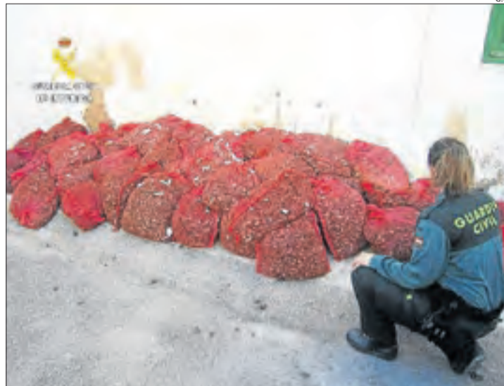
Part del producte intervingut al Baix Ebre.

A més, els caragols no tenien etiquetatge, ni guia sanitària, ni albarà de compra. Els caragols, pel que sembla, s'havien plegat en el seu entorn natural del País Valencià per a la seua distribució en diferents comerços de restauració de la