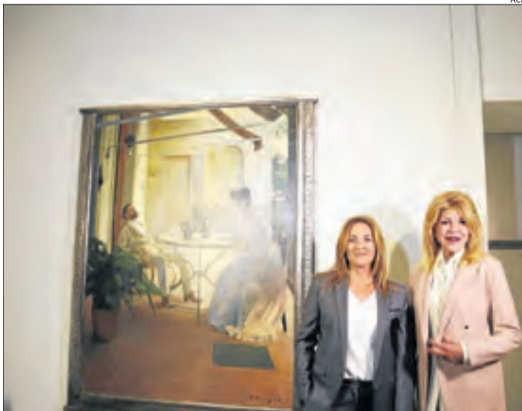
La ministra Olga Gelabert i la baronessa Thyssen, a l'exposició.

■ A l'avinguda Carlemany, 37, de dimarts a dissabte (10 a 19 h) i els diumenges (10 a 14). 9 €