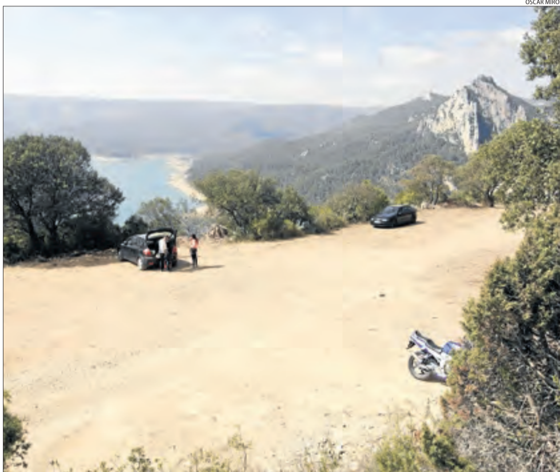
L'aparcament de la zona de la Pertusa que ja està totalment operatiu i té cinquanta places.

D'altra banda, els ajuntaments de Sant Esteve de la Sarga, Àger, Viacamp i la Fundació Catalunya-la Pedrera (titular de la part catalana del congost) estan ultimant les mesures per evitar col·lapses per Setmana Santa. Unes mesures que s'aplicaran en unes setmanes i permetran informar en temps real de l'ocupació dels pàrquings (el de la Masieta i el nou de la Pertusa), un web que possibilita fer reserves online i instal·lar plafons informatius per guanyar seguretat i informar del nombre de turistes que hi ha a la zona del congost.