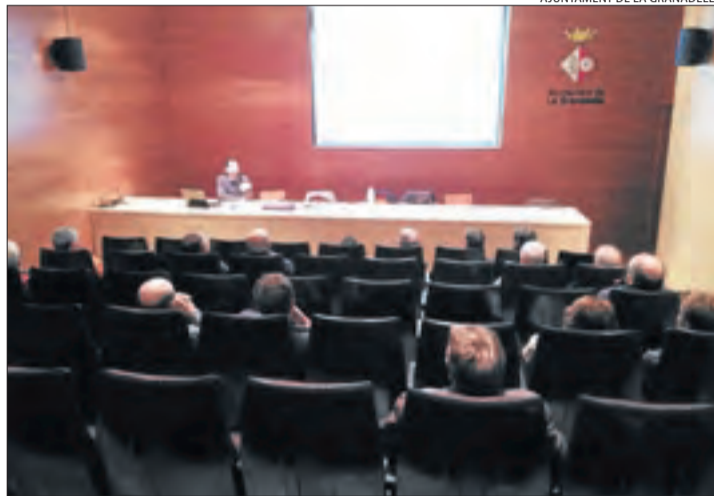
La presentació de l'estudi ahir a la Granadella.

L'estudi xifra en 3,5 milions d'euros la construcció i la connexió a la xarxa elèctrica del molí, una inversió que requeria un termini d'amortització d'entre 8 i 11 anys a través de la venda d'energia a preu de