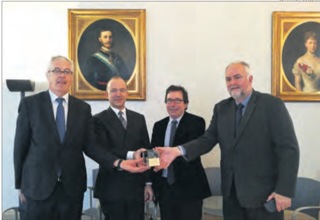
DEPARTAMENT DE CULTURA

La investigació de l'abellaïta a la mina de la Torre de Capdella coneguda com a Eureka no va acabar el 2010. I és que està previst que aquesta continuï a partir d'un conveni que firmaran l'ajuntament i l'Institut Jaume Almera.