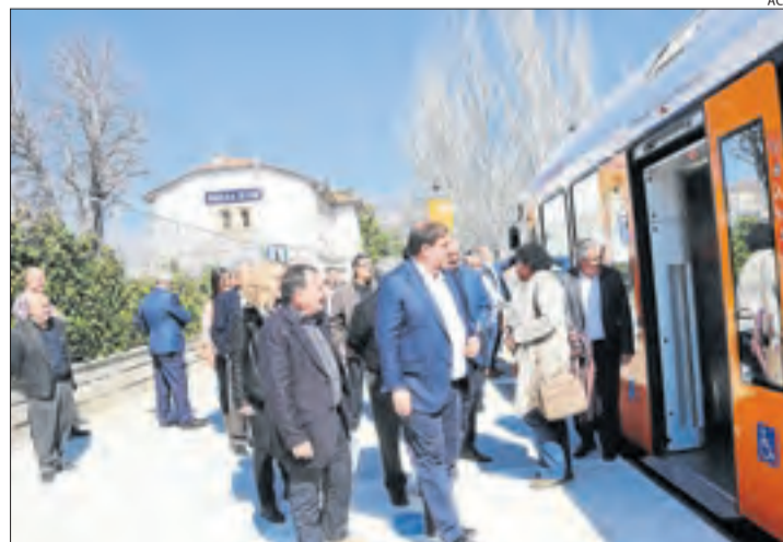
Junqueras, durant la visita a l'estació de tren de la Pobla.

El vicepresident va reconèixer, a més a més, el dèficit d'infraestructures del Piri-